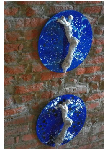
Arbeit des Künstlers Norbert Nolte

Sonderausstellung „Voglio Vedere“ von Norbert Nolte vom 24. April bis 1. November 2020 [verlängert]: Auf der Miltenburg werden Arbeiten des Nürnberger Künstlers Norbert Nolte gezeigt. Der Objektkünstler beschränkt sich mit seinen Raumarbeiten nicht auf den Sonderausstellungsraum im Obergeschoss, er bindet das ganze historische Gebäude mit ein. Auch im Museum Stadt Miltenberg wird es „Hinweise“ auf die Ausstellung geben. Noltés große Objektinstallationen und Collagen zeigen immer wieder Zitate aus der Kunstgeschichte und Literatur – aber mit einem Augenzwinkern. Der Künstler (*1952) lebt in Nürnberg. Er hat Kunst und Germanistik in Kassel studiert.