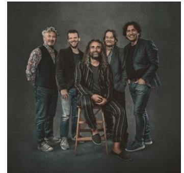
„The Jets“

Stadthalle Lohr Jahnstraße 8 97816 Lohr a.Main Tel. 09352 606 96 00 www.stadthalle-lohr.de